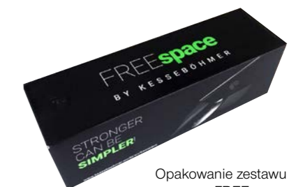
Opakowanie zestawu FREEspace